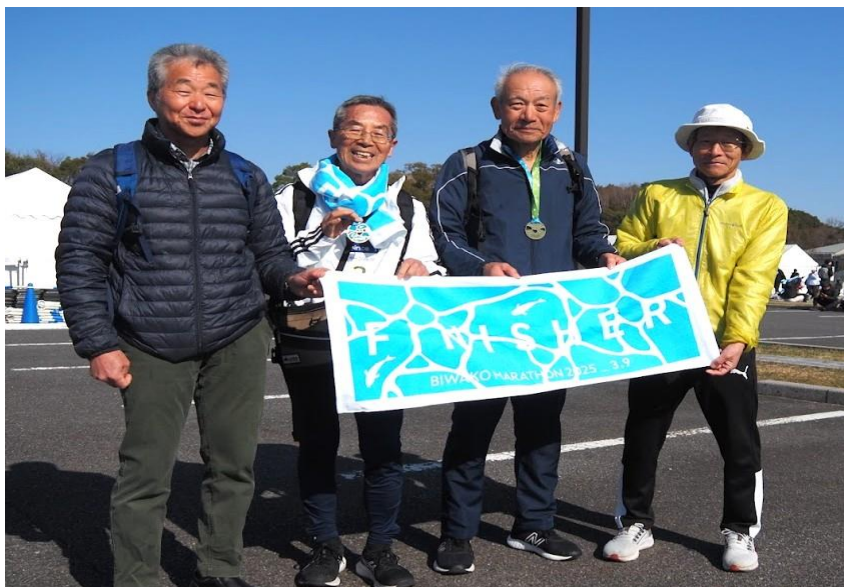
(完走メンバー S 竹 ・ N 村 ・ K 原 ・ I 東)