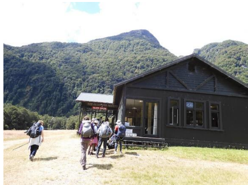
グレードハウスに到着

(1月17日)行動予定：(2日目)グレードハウス～クリントン小屋～デッド・レイク～プレーリー・レイク～ポンポローナロッジ泊 歩行時間 5-7時間/16km