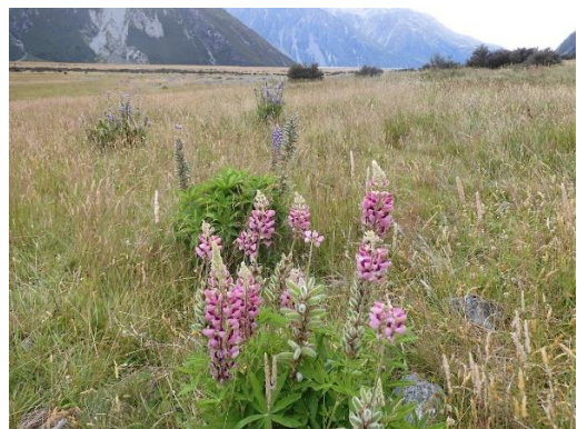
咲き誇るルピナスの花

(1 月 25 日) 行動予定: 星空観測(ダークスカイ・プロジェクト)～レイク・テポカ～バスでクイーンズタウンへ移動～クイーンズタウンのコプソーンホテル&リゾート・ホテル泊