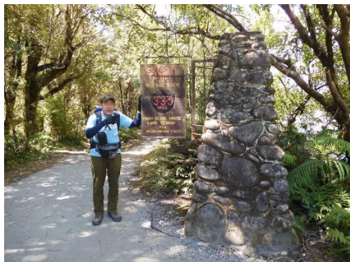
ミルフォードトラックのゴール

クインティンロッジを 7:30 に出発し、ダンブリング小屋、ポート・シェッドを通過して 11:10 にマッカイ滝に到着した。テレグラフ・ポイントからジャイアンツゲート滝ランチシェルターを通過して 13:20 にエイダ滝に到着してランチ。15:30 にミルフォードトラックのゴール地点であるサンドフライポイントに到着し、40 名中 15 位であった。サンドフライポイントと言うだけあって、虫のサンドフライがいっぱいいで大変でした。その後、ボートでミルフォードサウンドのマイターピークロッジに移動した。夜、ホテルで参加者全員によるミルフォードトラック踏破記念夕食会に参加した。