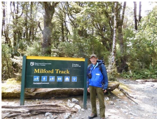
ミルフォードトラックのスタート

クイーンズタウンの Ultimate Hikes 事務所に 9:15 に集合し、バスでミルフォードトラック入口まで移動。1日目は足慣らしで 1.6km を歩く。今回のツアー参加者は 40 名、ガイドは 3 名です。参加者の国籍はオーストラリア、ニュージーランド、アメリカ、カナダ、イギリス、ドイツ、香港(中国)、台湾、韓国、日本です。歩行距離は 54km(33.5 マイル)。