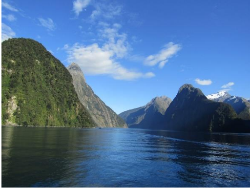
ミルフォードサウンド