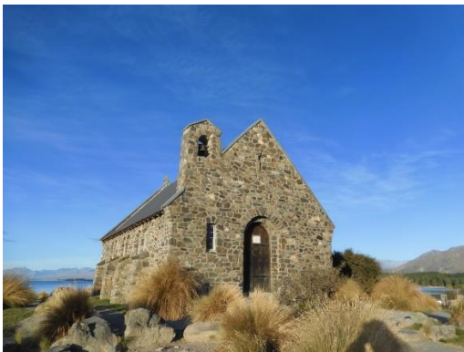
善き羊飼いの教会

ハーミテージホテルを 15:15 にバスで出発してレイク・テポカに向かう。レイク・テポカのペッパーズブルーウォーターリゾート・ホテルに 17:30 到着。歩いて近くの湖畔にたたずむ有名な「善き羊飼いの教会」を散策。