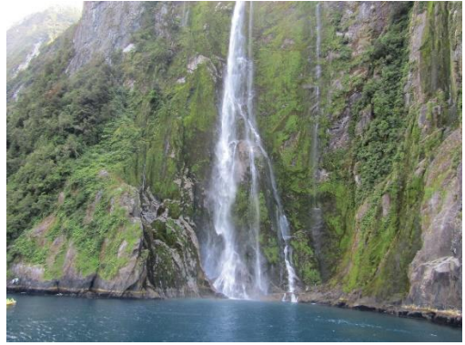
ミルフォードサウンドの滝