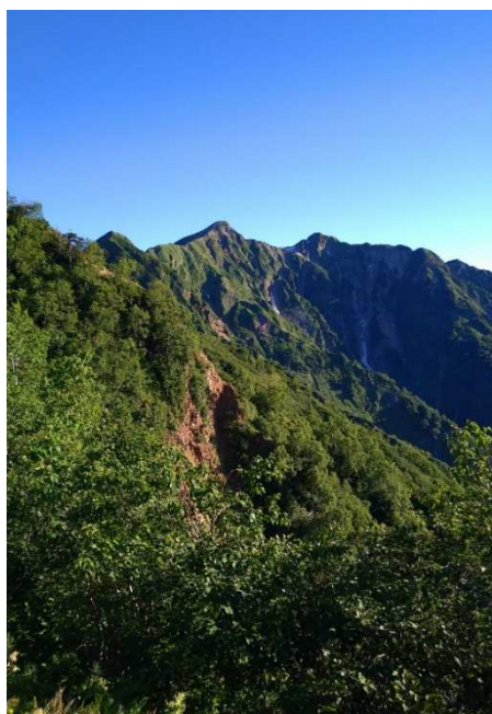
↑冷池山荘からみた鹿島槍

お昼過ぎに下山できましたが、登山後の運転に自信のないおばさん二名迷わず現地宿泊しました。黒部観光ホテルではウェルカムタイムとやらでビールとおでん無料でした(^♪ ゆっくり休んで翌日 8 時出発、14 時着。