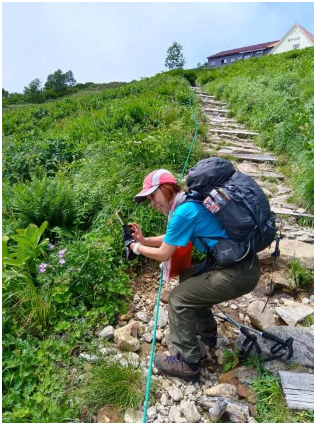
種池山荘直前、写真を撮りつつ大休憩