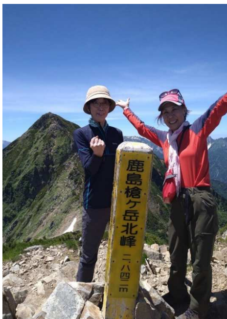
↑鹿島槍北峰登頂記念、(^。^)/