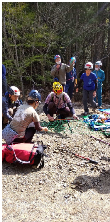
鹿よけネットを使った担架づくり