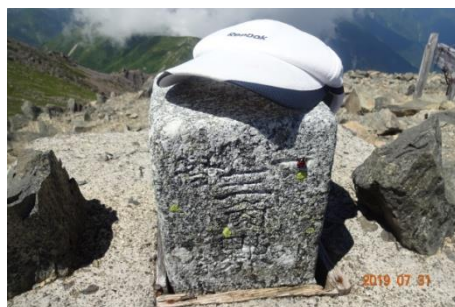
(一等三角点赤石岳)