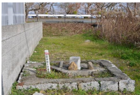
(一等三角点深溝村)

◇ところで県内には、一等は11点ありますが、山頂に8点、饗庭野演習場内に2点、残る1点は新旭町深溝の湖岸にある点名深溝村（標高86.95m）です。これで等級は三角網を表し山自体の等級を表すものではないと分かりますね。ちなみに一等三角点の 最高峰 は、 標高 3,121 mの点名 赤石岳 です。 K.K