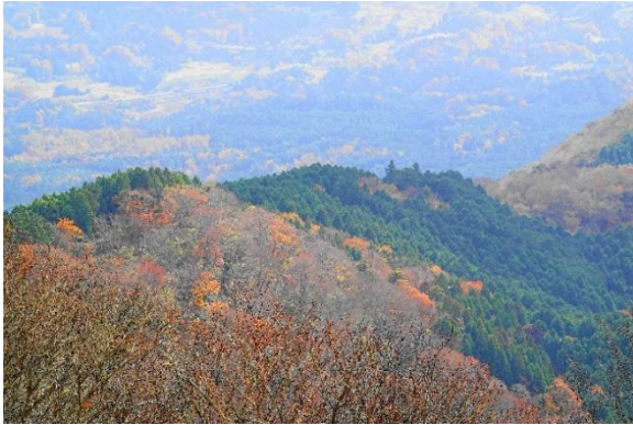
権現山～栗原 東南尾根