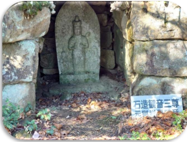
岳山 石造観音三尊