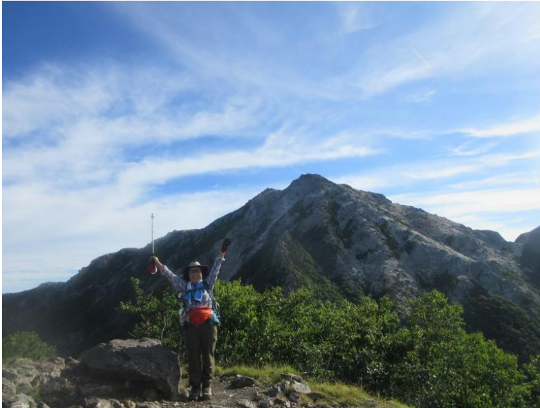
駒津峰にて 甲斐駒ヶ岳を背景に

花崗岩の白砂からなる一帯で 本当にこの世のものかと思うほど明るく不思議な感じがしました。話は変わりますが、次の日は雨予報が出てしまい（最初は 2 泊 3 日の予定で仙丈ヶ岳 へも登る予定でした）テントを撤収する人が目立ちました。テント場にいたおじさんの なかには、「早朝に雨がくる前に登ってしまうつもり」とか「いつも天気なんか見てない」などと言う強者もおられました。私は後ろ髪ひかれる思いで仙丈岳登山を断念しました。（家族からは褒められましたが...。(^-^;) 記：S藤